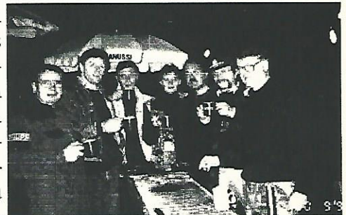
Stellvertretend für alle Helfer(innen) Das Bratwurst-Team

der gern auch mit "Schuß" genommen wurde, um den Erwärmungsprozeß zu beschleunigen. Im gut besuchten