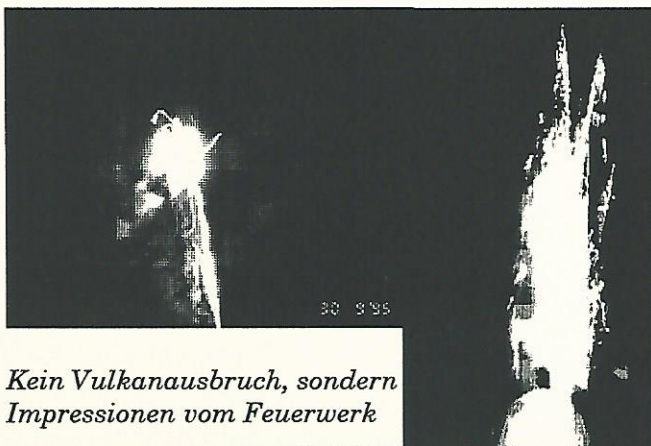
Kein Vulkanausbruch, sondern Impressionen vom Feuerwerk

Da es inzwischen dunkel geworden war, startete auch bald unser großes Feuerwerk, wie immer